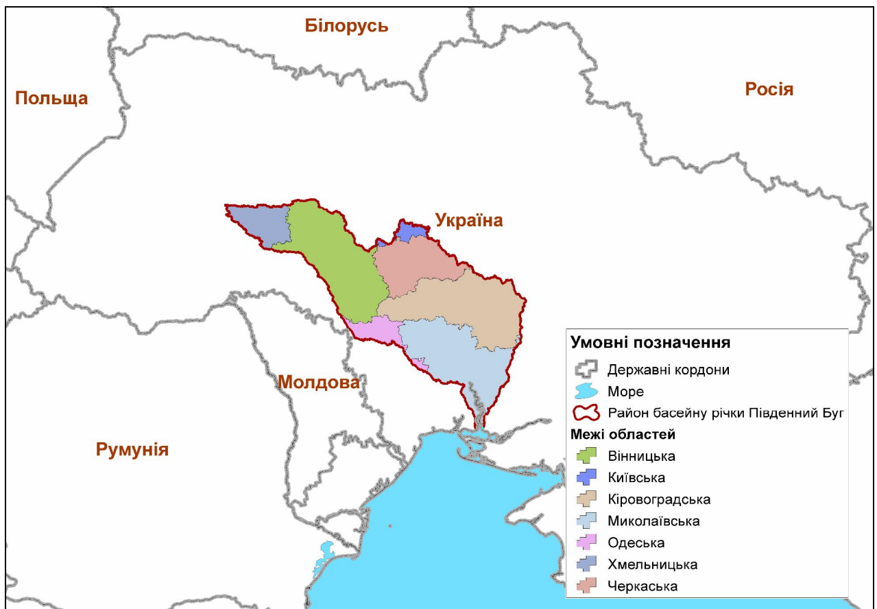
Рисунок 2.1 – Розташування району басейну річки Південний Буг

Район басейну річки Південний Буг є цілісним, складається з басейну р. Південний Буг та перехідних вод. Межа району басейну р. Південний Буг проходить через населені пункти по лінії вододілу [4]. Територія району басейну річки Південний Буг зосередження в межах семи областей України (Вінницька, Київська, Кіровоградська, Миколаївська, Одеська, Хмельницька, Черкаська) (рис. 2.1).