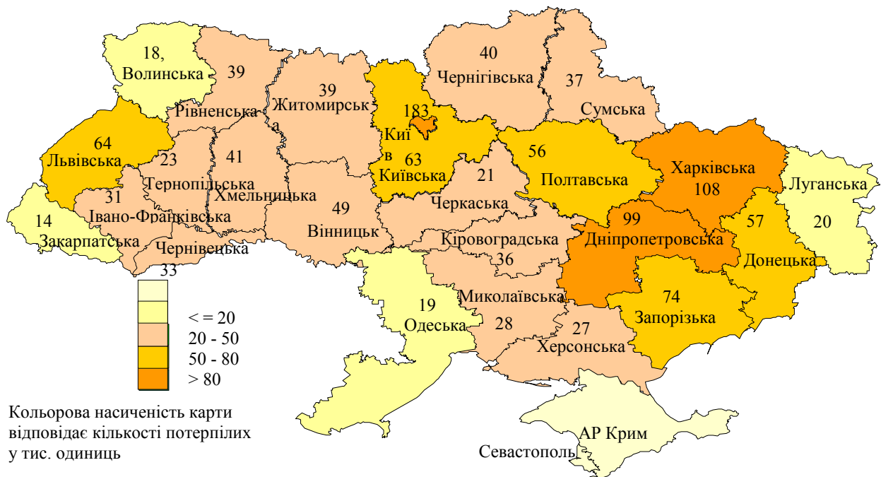
Розподіл кількості потерпілих від нещасних випадків невиробничого травматизму за регіонами України за 9 місяців 2018 року (у тисячах одиниць)

Серед причин травмування у побуті падіння складає 57,7 % всіх нещасних випадків травматизму невиробничого характеру, кількість потерпілих становить 704 тис. 595 осіб.