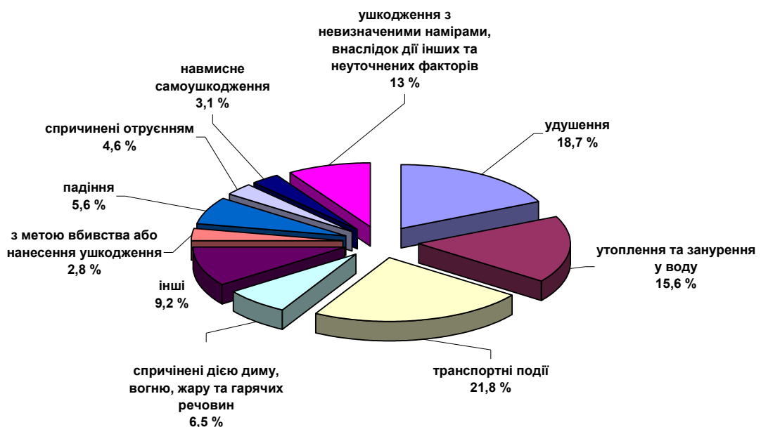
Питома вага нещасних випадків невиробничого характеру зі смертельним наслідком в Україні за 12 місяців 2016 року серед дітей віком до 14 років

Від нещасних випадків невиробничого характеру в Україні за 12 місяців 2016 року загинуло 321 дитина у віці до 14 років.