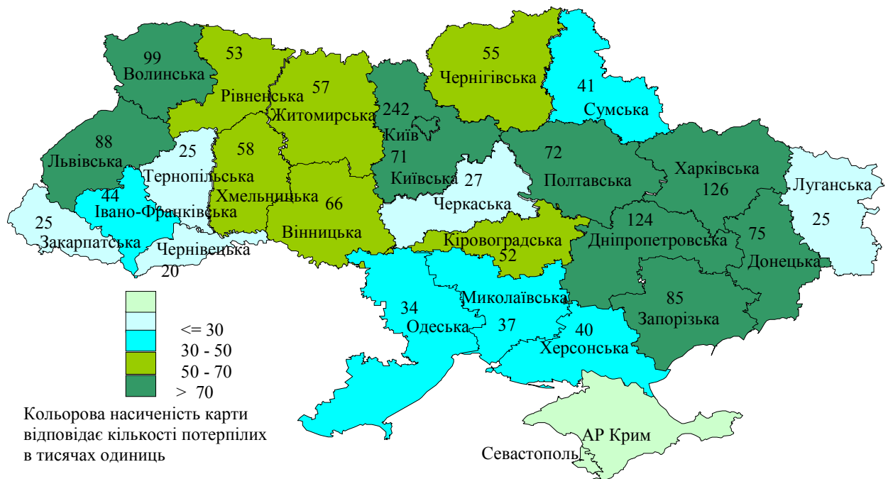
Розподіл кількості потерпілих від нещасних випадків невиробничого характеру за 12 місяців 2016 року за регіонами України (у тисячах одиниць)

Серед причин травмування у побуті падіння складає 56,4 % всіх нещасних випадків травматизму невиробничого характеру, кількість потерпілих становить 924 тис. 433 особи.